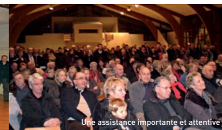
Une assistance importante et attentive

- Développement de la communication avec les Infos mensuelles, la Lettre trimestrielle, l'Agenda ainsi que le Site www.drumettaz.com mis à jour chaque semaine. - Réalisation de travaux: montée du Mollard, aménagement de l'école, réseaux trottoir, terrain de tennis et mise en route du chantier de la Zone du Pontet et du réservoir de Sillien. - Création du Marché dominical en juin, qui sera étoffé au printemps.